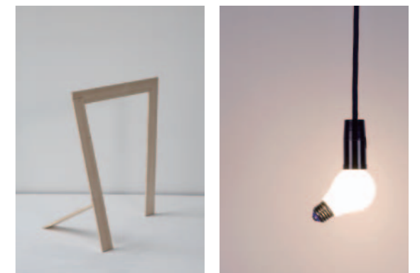
design: KUENG CAPUTO