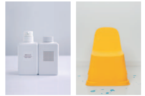
design: Sam Hecht/Industrial Facility

お問い合わせ: DESIGNEAST 実行委員会 大阪市中央区北浜東 1-29-5F 〒540-0031 TEL 070 5509 5731 MAIL contact@designeast.jp WEBSITE www.designeast.jp