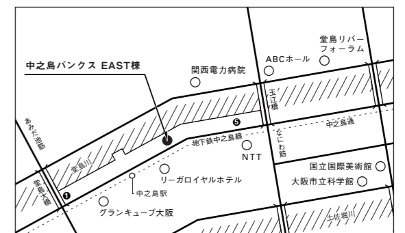
design: Hironao Tsuboi