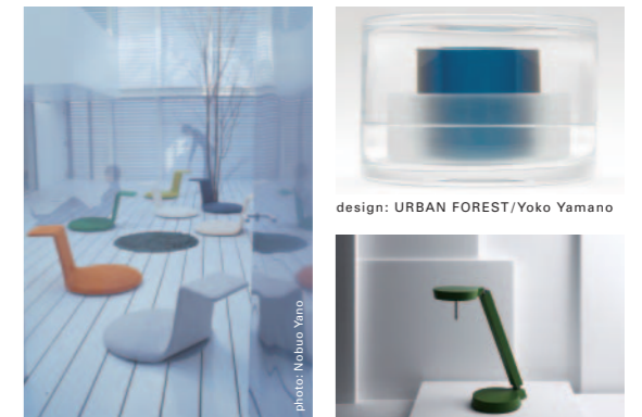
design: CKR/manufacture: E&Y