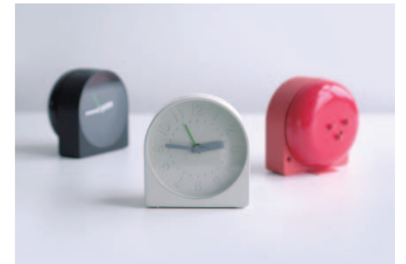
design: Sam Hecht/Industrial Facility